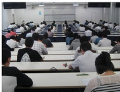
東京会場でのアドバイザー試験風景